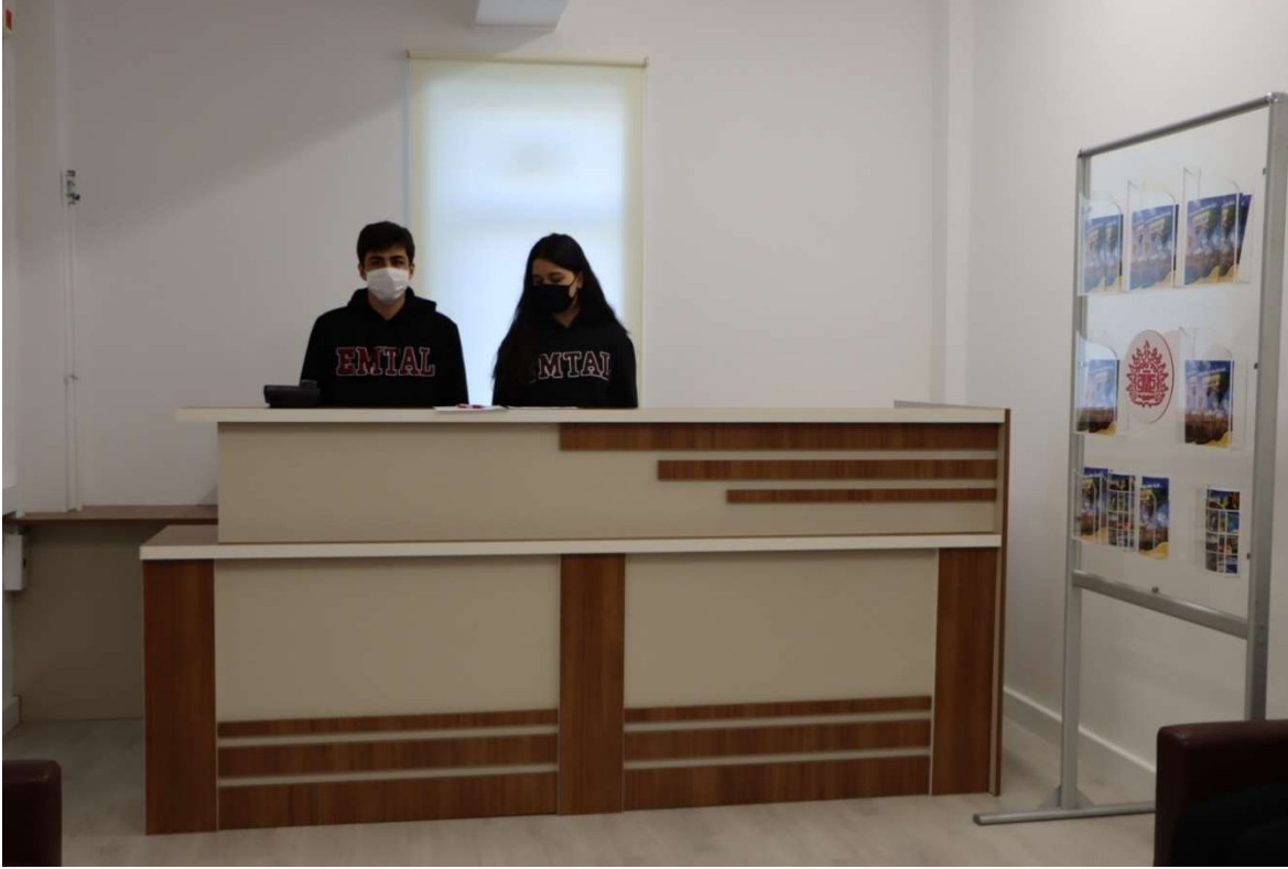
Ön Büro Atölyesi